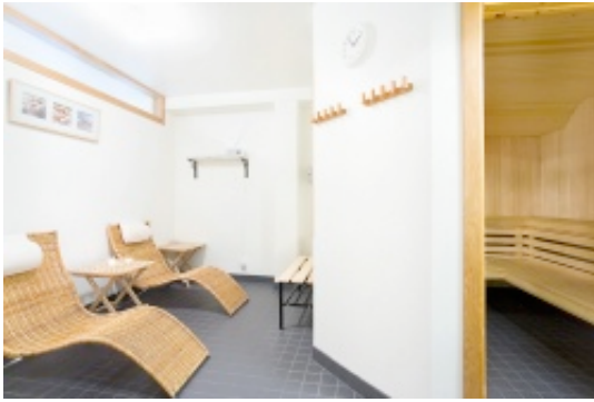
Relax och bastu