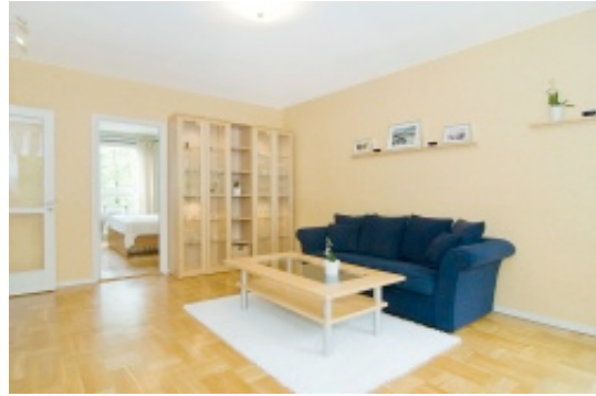
Vardagsrummet mot sovrum 2