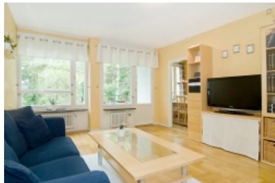
Vardagsrummet mot balkongen