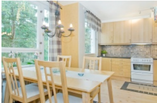
Matplats i köket

Stockholm Centralstation 6,6 km Järnvägsstation 6,6 km Flemingsberg Järnvägsstation 12,2 km