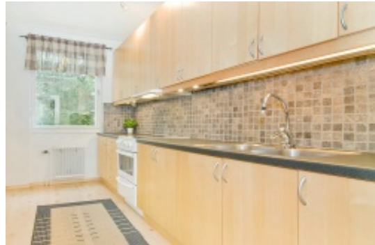
Det smakfulla köket