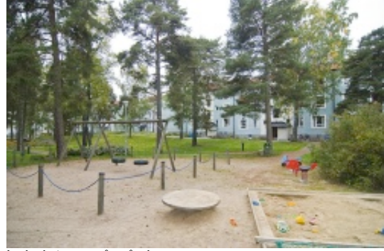
Lekplatsen på gården