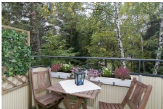
Balkong mot grönskan