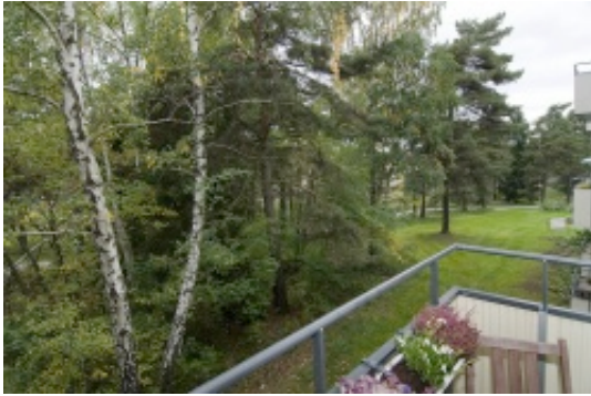
Utsikt från balkong