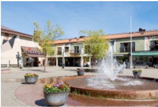
Årsta Torg Folkets bio